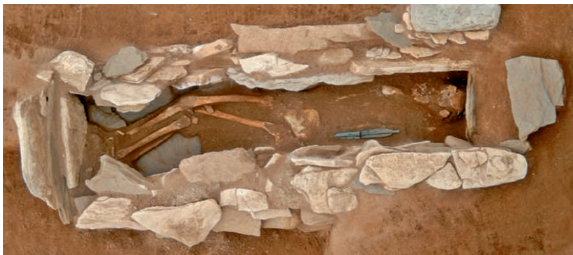
Рис. 3. Погребение в каменном ящике № 2 Хари (ил. по: [Хван Джонук, 2017, с. 41]).

Среди всех захоронений наибольший интерес представляет погребение № 2, расположенное в северной части могильника. Оно выделяется среди прочих конструкций своими размерами. Кроме того, сохранность у этого погребения гораздо лучше, чем у остальных. Погребение № 2 представляет собой помещенный в грунтовую яму каменный ящик из поставленных на ребро известковых плит. Верхняя часть стенок ящика сложена из плитняка. Плитняком заполнено также и пространство между стенками могильной ямы и ящика. Размеры ящика составляют 1,63 \times 0,53 м, высота – 0,25 м. Перекрытие ящика образовано отдельной плитой слюдяно-глинистого сланца размерами 1,68 \times 1,04 м. Обнаруженный в захоронении антропологический материал представлен практически целым скелетом – черепом с нижней челюстью, зубами, костями рук и ног (рис. 3). В процессе зачистки захоронения удалось зафиксировать позу погребенного: захоронение совершено в вытянутом положении на правом боку с согнутыми в коленях ногами, головой на север [Пхёнчхан Пхёнчхан-ып Хари..., 2016, с. 15–17]. Комплекс инвентаря захоронения включает бронзовый скрипковидный кинжал, каменные черешковые наконечники стрел, нефритовые пронизки и нефритовую диско-видную подвеску. Скрипковидный кинжала залегал в восточной части каменного ящика, в районе нижней части грудной клетки и поясницы погребенного. До совершения захоронения он был сломан в сред-