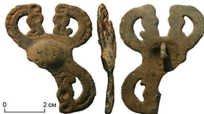
Рис. 4. Бронзовая сбруйная бляха из погр. 9а.

Кольчатые железные удила имеют широкую хронологию бытования. Они часто встречаются в могильниках XVII–XVIII вв. Ближайшие аналогии обнаружены на могильниках Окунево VII [Матющенко, Полеводов, 1994, рис. 74, 22; 78, 20], Кыштовка II [Молодин, 1979, с. 176, табл. XLIV–2,3,4] и др.