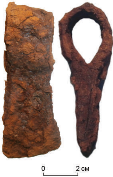
Рис. 2. Железный топор из погр. 5.