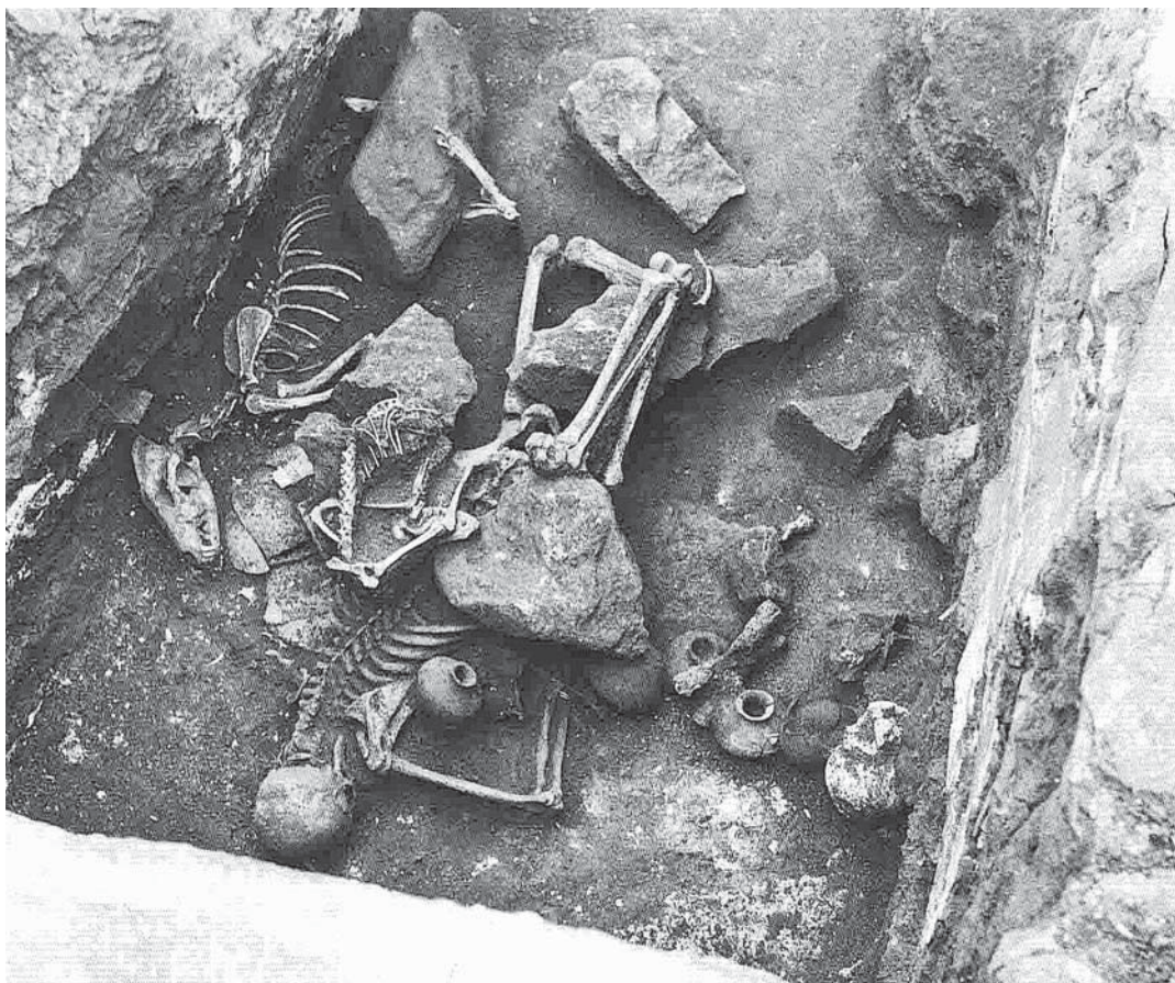
Рис. 1. Погребение супруги Фэн Суфу. Западная часть. По: [Бэй Янь..., 2015, вкл., илл. 13].

По всей видимости, реальные животные, захороненные в погребении, призваны были помочь душе покойной в безопасности достичь священной горы Чижань. Процессия, нарисованная на южной стене, показывала это путешествие в загробный мир. Семантика же росписи на западной стене