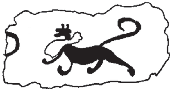
Рис. 4. Изображение собаки на настенной росписи в погр. 1 у дер. Бэймяоцунь, г. Чаоян. По: [Сюй Цзи, Сунь Гопин, 1985, с. 923].

ние сходно с могилами Фэн Суфу и его жены, и, по-видимому, принадлежало аристократам-мужунам из царства Северная Янь. Фигура собаки размещалась на восточной стене под парным портретом мужчины и женщины – предположительно, супругов, похороненных в могиле. Росписи сохранились фрагментарно, однако авторы раскопок предполагают, что всего на восточной стене могли быть нарисованы три или четыре (как в погребении супруги Фэн Суфу) собаки [Сюй Цзи, Сунь Гопин, 1985, с. 921–923, 925–926]. Вероятно, и мать, и число изображенных животных совпадают не случайно, а представляют собой значимые элементы мифологического сюжета.