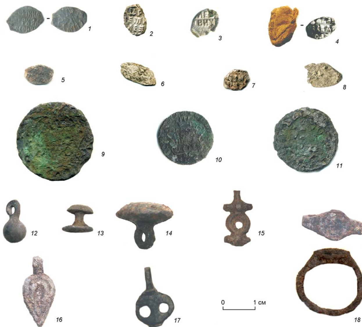
Рис. 1. Поселение Ананьино-I. Нумизматическая коллекция и детали костюмного комплекса из раскопа 2021 г.

1 – чешуйка, выпущенная в период правления Петра Алексеевича и его брата Ивана 1682–1696 гг.; 2, 3 – чешуйки начала XVIII в. – 1709 г.; 4–8 – неопределимые по дате монеты-чешуйки (4 – слева – чешуйка завернутая в ткань); 9–11 – монеты второй половины XVIII века (9 – деньга 1750 г.; 10 – полушка 177? г.; 11 – монета 17?? г.); 12–18 – детали костюма (12 – гирьковидная пуговица; 13 – заклепочная пуговица; 14 – мундирная пуговица с ушком для пришивания; 15 – фрагмент щитка сержки; 16, 17 – фигурные подвески; 18 – перстень). 1–8 – серебро, 9–11 – медь, 12–18 – металл.