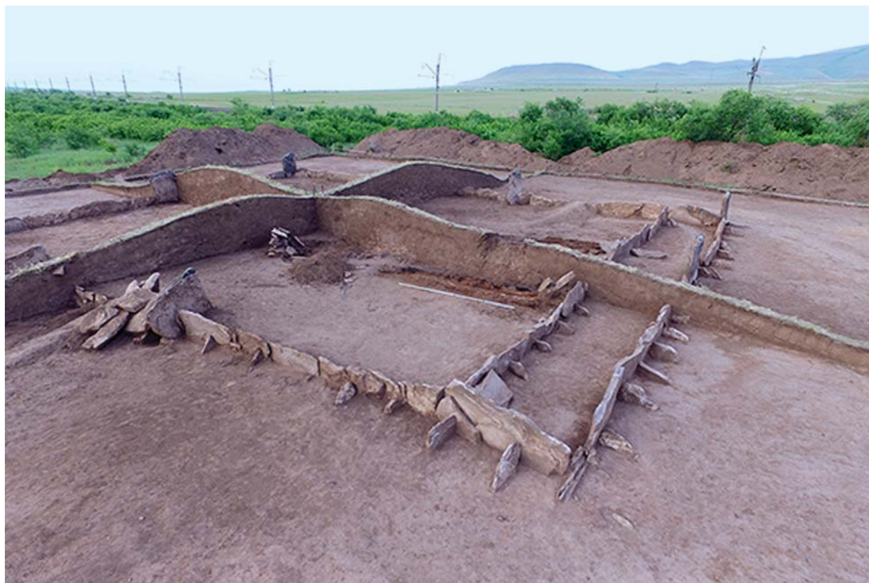
Рис. 2. Могильник Скальная 6, курган 1. Вид на ЮЗ угол ограды в процессе раскопок.

и впускных захоронений не выявлено. Погребение № 1 (центральное) и погребение № 2 (южное) представлены деревянными конструкциями, погребение № 3 (восточный сектор) сделано в каменном ящике. Плиты каменного ящика торчали на 20 см от уровня древней дневной поверхности. В восточной части ящик, ориентированный стенками по линии З – В, был перекрыт каменной плитой. На глубине 0,3 м у восточной стенки ящика было обнаружено погребение «А» – мужчины 40–50 лет (скопление костей в сложенном виде) (здесь и далее определения сотр. ИИМК РАН Лазаретовой Н.И.). Характер залегания свидетельствует о том, что они были помещены в каком-то мешке (емкости?), некоторые кости были в сочленении. Под скоплением расчищено погребение «Б» – юноши около 18 лет, кости скелета также в сложенном состоянии. Часть мелких костей ног и рук отсутствует. На дне каменного ящика, на глубине 0,75 м, обнаружено детское захоронение («В»). Ребенок был уложен вытянуто на спину, головой на запад. Часть костей ног и рук отсутствует, возможно, в связи с деятельностью грызунов. В районе тазовой кости лежала бронзовая полушарная бляшка с пуансонным орнаментом по краю и отверстием по центру. В углах ящика, по обе стороны от черепа, стояли два керамических сосуда. Правый представлен нижней частью горш-