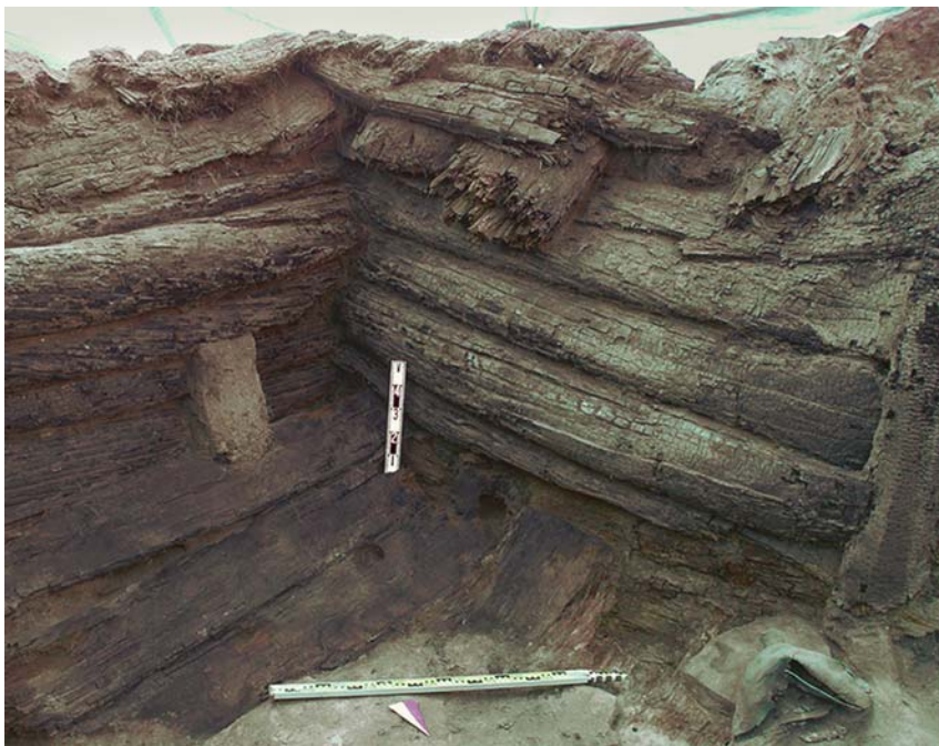
Рис. 5. Могильник Скальная 5. Остатки полатей в ЮЗ углу сруба. Вид с северо-востока.

(под потолок) был сделан вход-лаз со ступенями из параллельно уложенных плах, ведущими вниз. На дно склепа были поставлены два опорных столба для поддержки перекрытия над входом. Некоторые бревна сруба имели следы переиспользования (возможно, в жилых постройках): проушины для переноски, пазы, различные выемки и тесы, а также следы внешнего легкого обгорания. С внутренней стороны в бревнах были сделаны специальные пазы для закрепления полатей, распо-