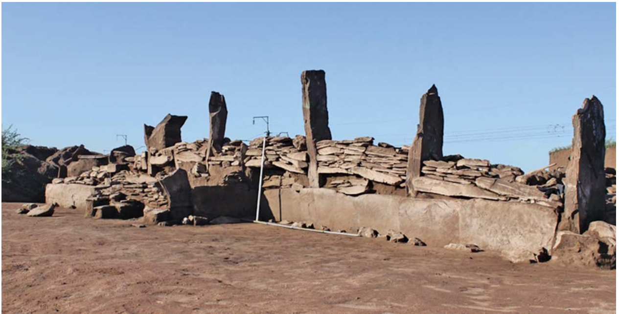
Рис. 4. Могильник Скальная 5. Фрагмент стены ограды. Вид с северо-востока.