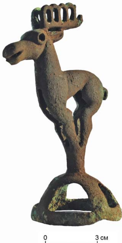
Рис. 3. Бронзовое навершие. Курганный могильник Скальная 6, курган 1, погребение 2.

Большинство исследователей подобные элитные комплексы относят к заключительной фазе сарагашенского этапа (лепешкинскому), опираясь на архитектурные особенности: массивность камней ограды, монументальность насыпи, тын внутри сруба, появление входа-лаза и т.д. [Вадецкая, 1986, с. 81; Кузьмин, 2011, с. 31–33]. А.Г. Аку-