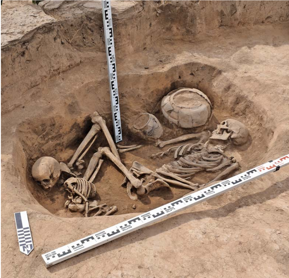
Рис. 4. Погребение в могиле 2 кургана 2 могильника Казановка-13. Вид с севера.

При зачистке и разборе насыпи были обнаружены фрагменты керамической курильницы (рис. 5, 2), целый маленький круглодонный сосуд, фрагменты костей животных и человека.