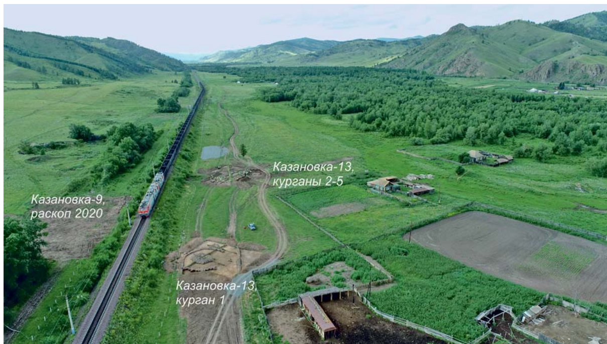
Рис. 2. Общий вид афанасьевского могильника с юга.