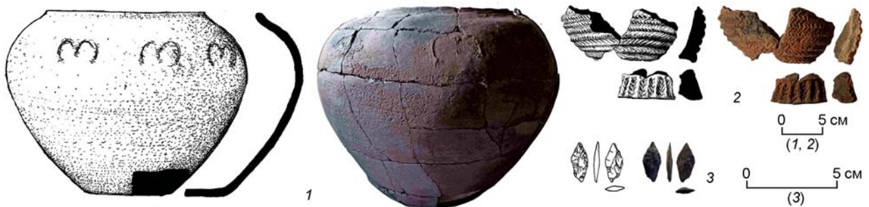
Рис. 5. Примеры сопроводительного инвентаря в курганах могильника Казановка-13.

1 – керамический сосуд из могилы 2 кургана 2; 2 – фрагменты керамической курильницы в насыпи кургана 2; 3 – каменный наконечник стрелы из могилы 1 кургана 3.