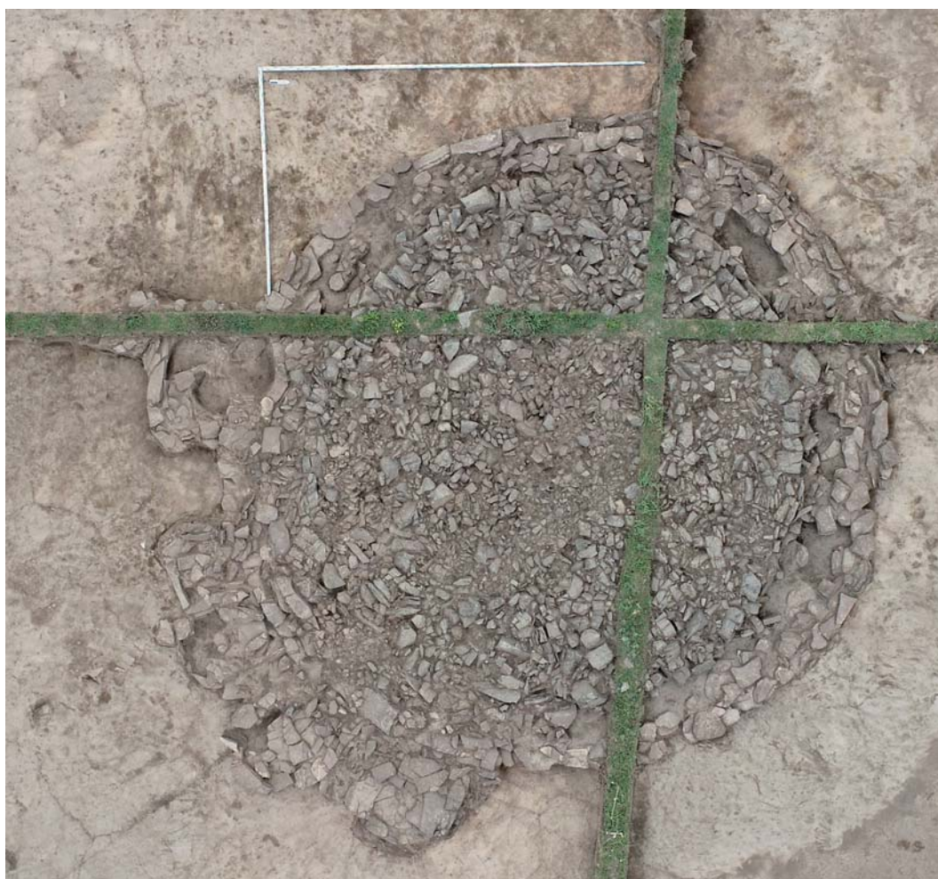
Рис. 3. Каменная конструкция кургана 3 могильника Казановка-13, север справа фотографии.