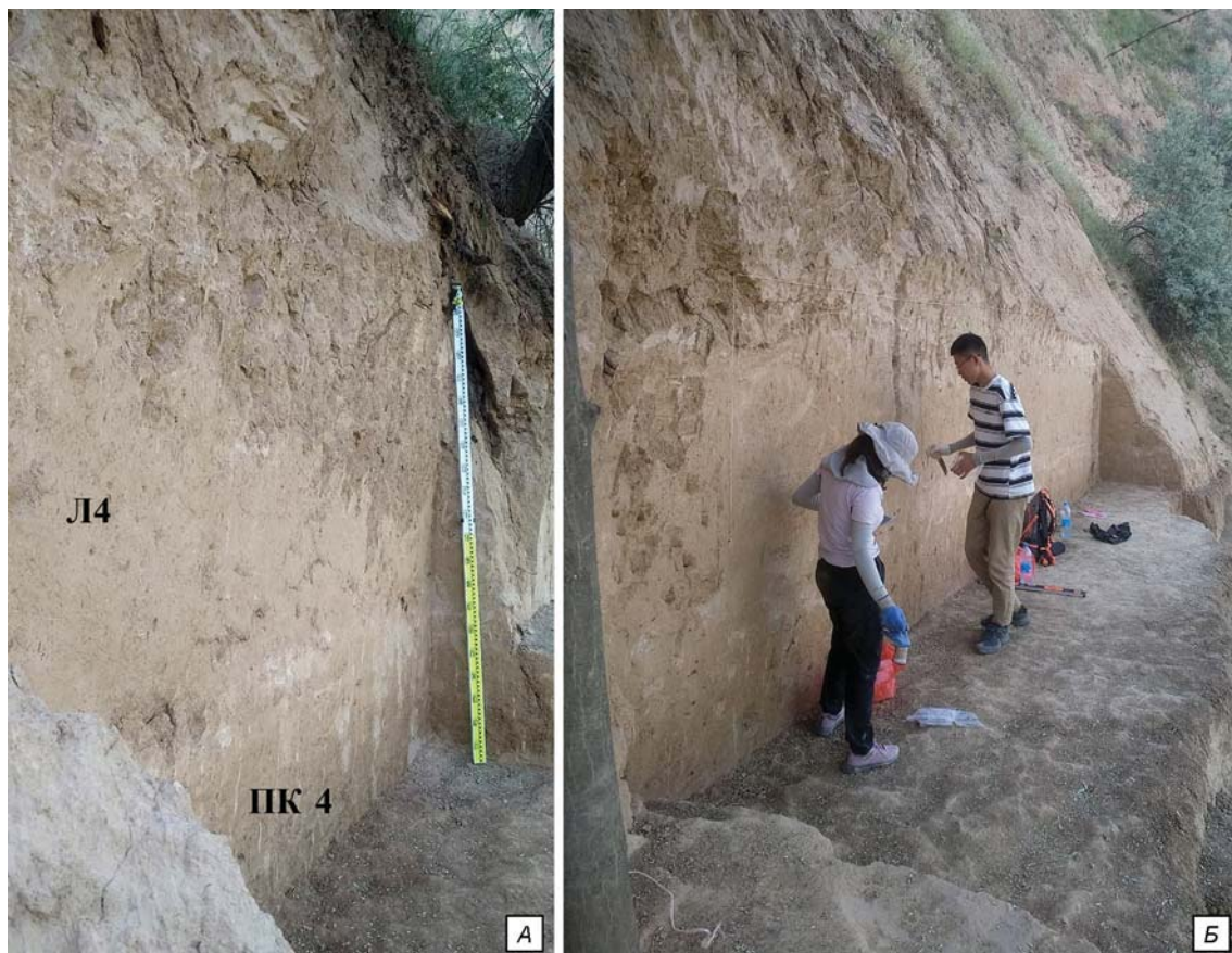
Рис. 2. Раскоп 4 (2023 г.) стоянки Лахути IV.

А – северо-западная стенка сектора II (вид с юга); Б – отбор образцов с северо-западной стенки сектора I раскопа 4.