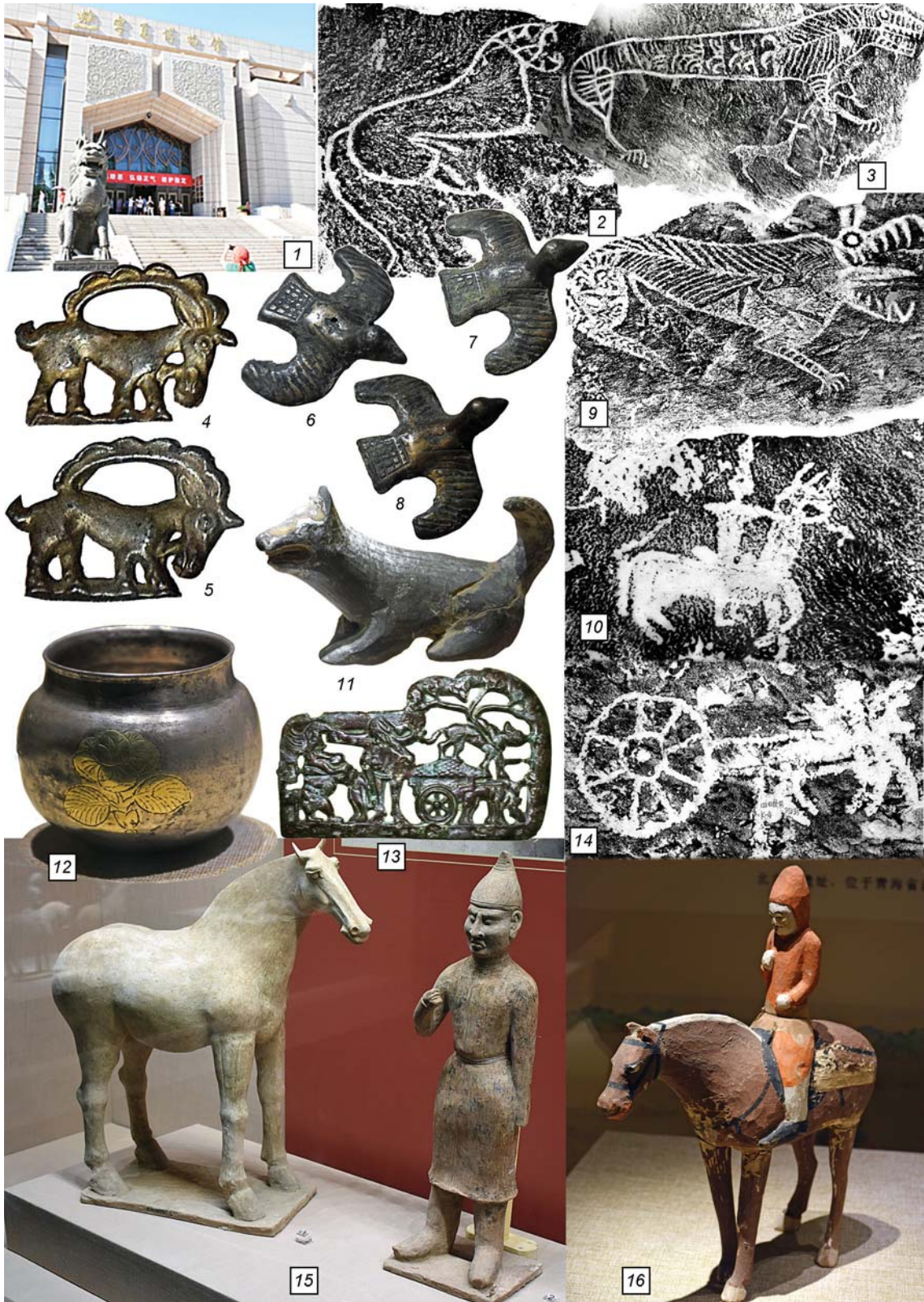
Рис. 3. Исторический музей Нинся-Хуэйского автономного района.

1 – у входа в музей; 2, 3, 9 – микалентные копии петроглифов с изображениями тигров; 4–8 – бронзовые фигурки козлов и птиц (ранний железный век, культура Янлан); 10, 14 – микалентные копии петроглифов с изображениями всадника и колесницы; 11 – керамическая фигурка собаки (эпоха Хань); 12 – серебряный, с позолоченным орнаментом сосуд (эпоха Тан); 13 – бронзовая хуннуская поясная пряжка (эпоха Хань); 15 – керамическая статуэтка человека, ведущего лошадь (эпоха Тан); 16 – керамическая статуэтка всадника (эпоха Северная Вэй).