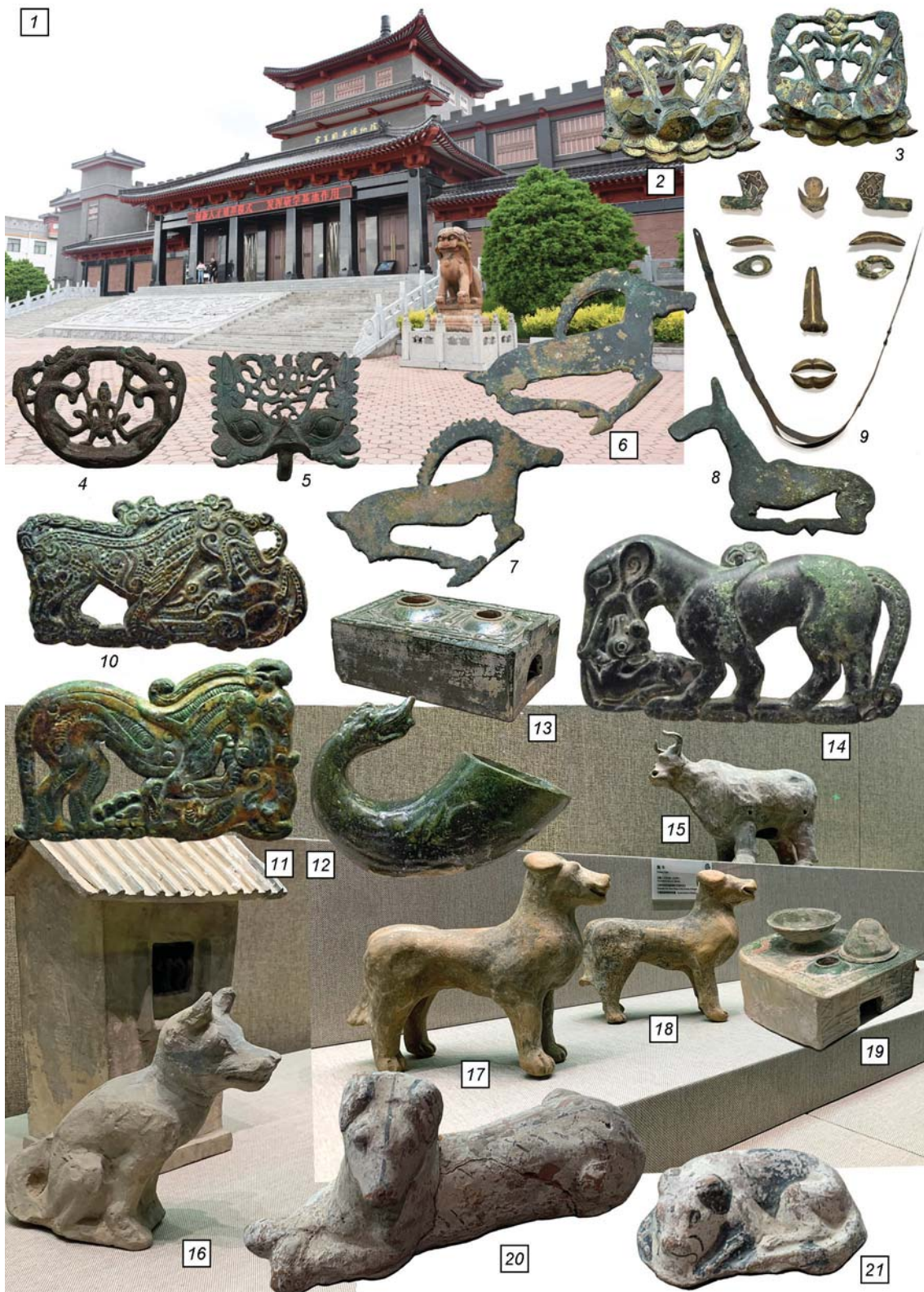
Рис. 5. Музей Гуюаня в Нинся.

1 – у входа в музей; 2, 3 – бронзовые позолоченные ручки (погр. у дер. Янфан, Северная Вэй); 4, 5 – бронзовые украшения гроба (погр. с лаковым гробом у дер. Лэйцзумяо, Северная Вэй); 6, 7, 8, 10, 11, 14 – бронзовые бляшки (эпоха Чуньцзо–Чжаньго); 9 – погребальная маска (погр. Ши Даодэ, 678 г.); 12 – керамический ритон (эпоха Хань); 13, 19 – керамические модели очагов (эпоха Хань); 15 – керамическая фигурка быка (Северная Вэй); 16 – керамическая фигурка собаки (эпоха Хань); 17, 18 – керамические фигурки собак (Северная Вэй); 20, 21 – керамические фигурки собак (погр. Тянь Хуна, 575 г.).