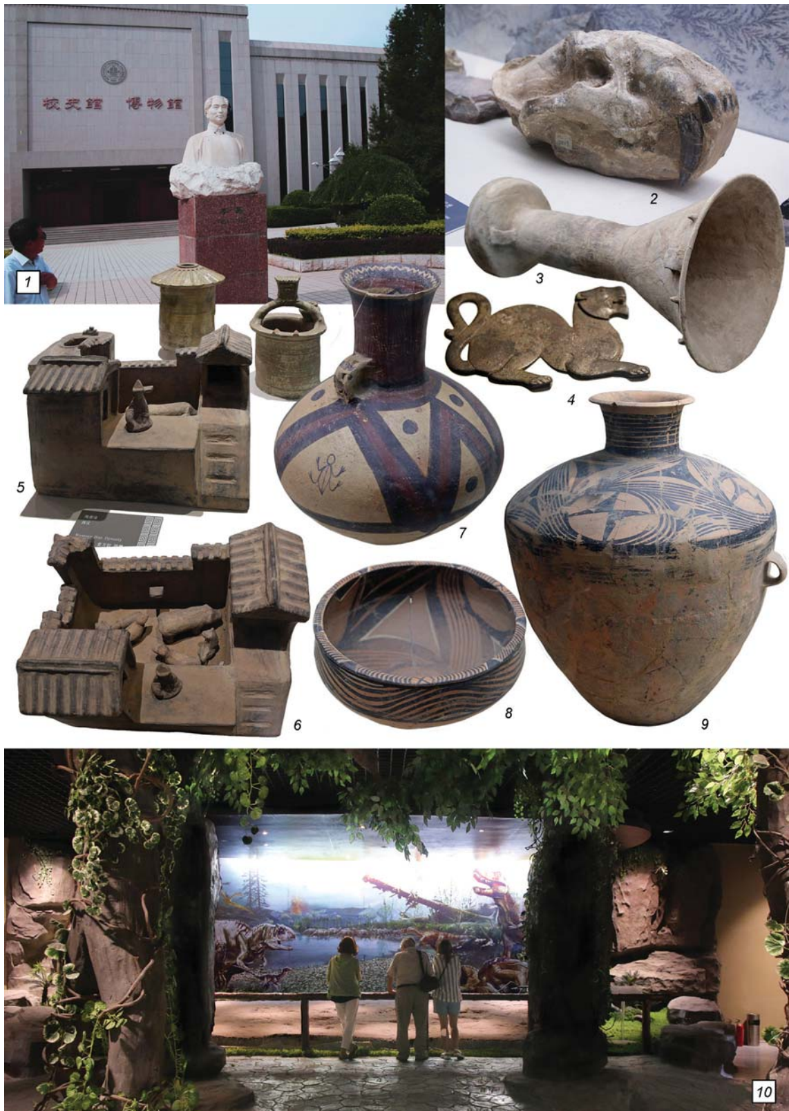
Рис. 1. Музей Северо-Западного педагогического университета в г. Ланьчжоу.

1 – у входа в музей; 2 – керамическая статуэтка животного (эпоха Хань); 3 – керамический барабан (энеолит, культура Цицзя); 4 – бронзовая бляха (эпоха Хань); 5–6 – керамические модели усадеб (эпоха Хань); 7–9 – неолитическая керамика (культуры Мацзяю и Мачан); 10 – экспозиция мезозойской эры.