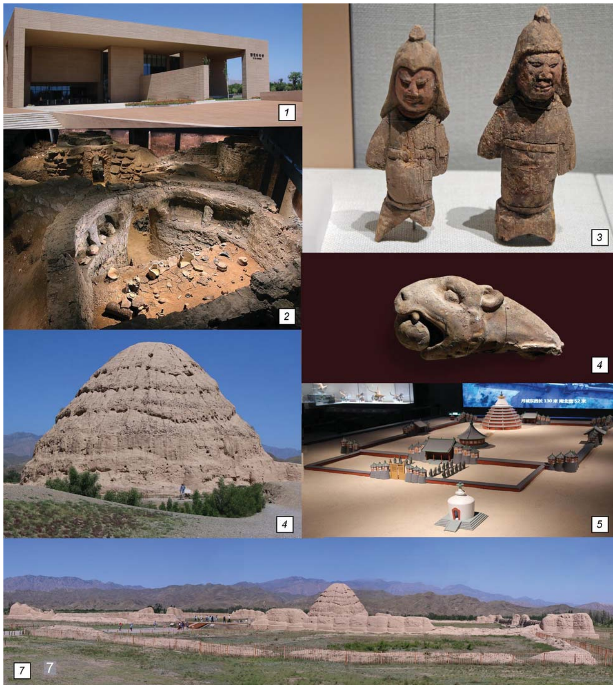
Рис. 4. Музей Западного Ся близ г. Иньчуань.

и за рубежом. Достойное место здесь занимает отечественная наука, начиная с экспедиции П.К. Козлова (1863–1935), открывшего 1908–1909 гг. мертвый город Хара-Хото с его библиотекой тангутских ксилографов. Много внимания уделено исследованиям пионера расшифровки тангутских текстов Н.А. Невского (1892–1937) и работам корифея советского и российского тангутоведения Е.И. Кычанова (1932–2013).