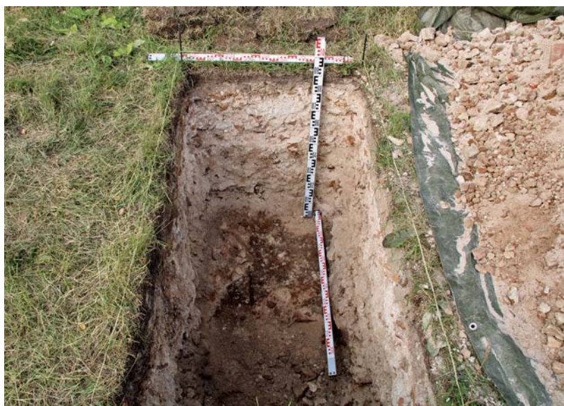
Рис. 2. Слой забутовки фундамента церкви Богородицы Одигитрии.

С целью уточнения границ культурного слоя шурф 2022/9 был заложен к северу от Богородицкого оврага. Культурного слоя ранее