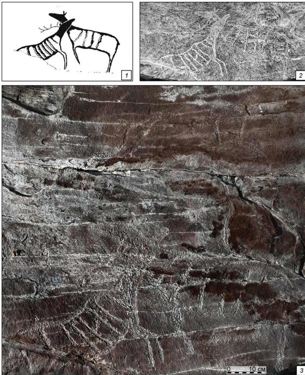
Рис. 2. Усть-Туба II, поверхность 1 (1а по индексации Я.А. Шера).

1 – прорисовка (по: [Шер, 1980]); 2 – микалентная копия, фрагмент, 2012 г.; 3 – фотография центральной части после частичного удаления кальцитовой пленки, 2023 г.