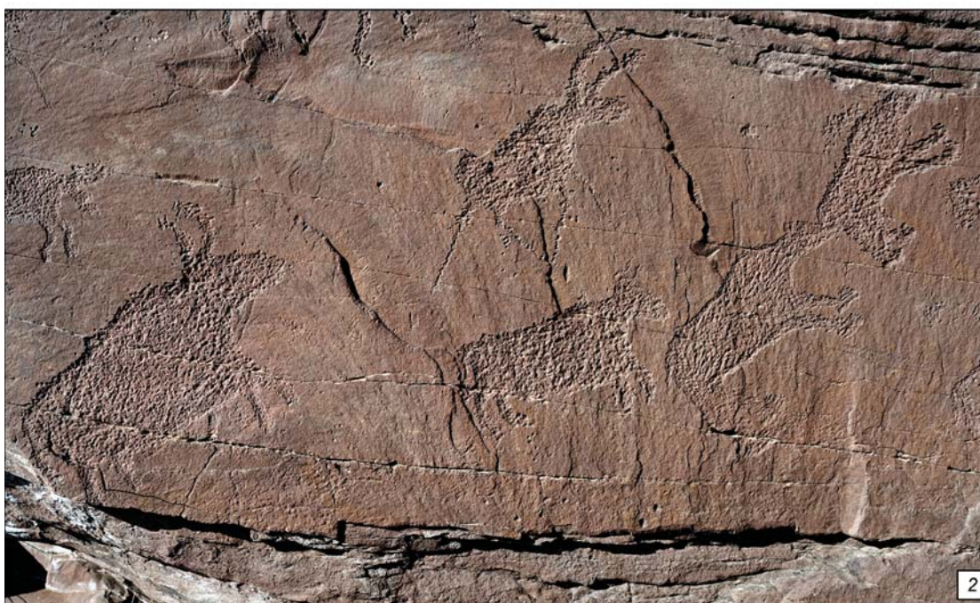
Рис. 1. Местонахождение Усть-Туба II.

1 – общий вид (с юго-востока), точками показано расположение поверхностей с наскальными изображениями (красными – с изображениями древнейшего пласта); 2 – фрагмент поверхности 17 (6 по индексации Я.А. Шера) после удаления лишайника. Фото 2023 г.