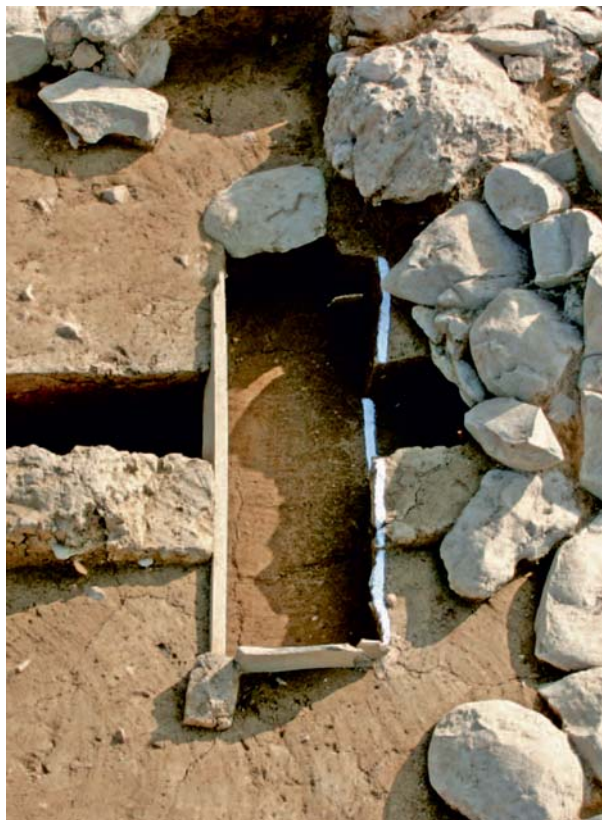
Рис. 2. Памятник Игонни. Внутримогильное сооружение объекта 27 (по: [Пэ Докхван, Ли Хэсу, Сон Минджу и др., 2007, фото 11, 2]).

Объект 33 расположен в подошве склона в составе группы аналогичных сооружений 27, 28, 30 и 31 в границах раскопа В. Насыпь объекта подпрямоугольной в плане формы, размерами 3,9 \times 3,5 \times 0,4 м, ориентирована продольной осью по линии С–Ю, перпендикулярно продольной оси центрального объекта группы 30. Периметр насыпи выложен несколькими слоями крупных каменных плиток, а внутреннее пространство заполнено землей и галькой. В центре насыпи располагался ящик, стенки которого, как и у внутримогильного сооружения объекта 30, состоят из уложенных слоями каменных плиток. Размеры ящика – 1,6 \times 0,6 \times 0,36 м, ориентация продольной оси конструкции совпадает с насыпью (рис. 3) [Там же, с. 217–223]. Находки из насыпи представлены, главным образом, фрагментами гладкостенной керамической посуды. Здесь также выявлены каменные артефакты: скребок и топор. Находки из каменного ящика представлены керамическим сосудом со следами окрашивания темным пигментом на поверхности и 2 амазонитовыми бусинами [Там же, с. 224–227].