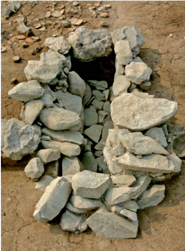
Рис. 3. Памятник Игонни. Внутримогильное сооружение объекта 33 (по: [Пэ Докхван, Ли Хэсу, Сон Минджу и др., 2007, фото 12, 2]).

можно отнести наличие каменной или каменно-земляной насыпи относительно правильной геометрической формы – округлой, подквадратной или подпрямоугольной. По центру насыпи расположен единичный ящик. Стенки ящиков состоят из поставленных на ребро удлиненных тонких плит, реже – уложенных слоями каменных плиток. Иногда на поверхности насыпи устанавливался крупный камень, выполняющий функцию, аналогичную крышке дольмена. В одном случае зафиксирована конструкция типа входа – коридора, пристроенного к торцевой стенке ящика. Судя по размерам внутримогильных конструкций и известным аналогиям, каменные ящики содержали одиночные захоронения. Вероятно, захоронения принадлежали членам одной общины.