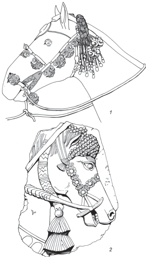
Рис. 2. Изображения конских голов.

1 – реконструкция оголовья коня, захороненного в кург. 1 мог. Ак-Алаха 3; 2 – прорисовка конской головы с ассирийского рельефа.