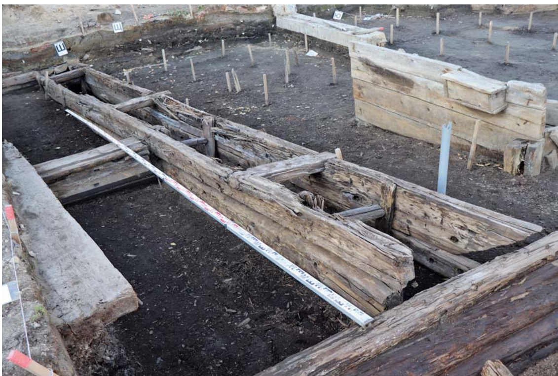
Рис. 3. Вид ливневки, сложенной из деревянных тесаных плах.

ками и верхним перекрытием из карбасных досок (рис. 3). Внутри канала зафиксирована система деревянных распорок, предотвращавшая завал боковых стенок. В северо-западной стенке раскопа зафиксирована стенка бокового канала, соединяющегося с вышеописанным. Похожая конструкция обнаружена в юго-восточной части раскопа, однако расположена она несколько ниже по уровню и сохранность ее значи-