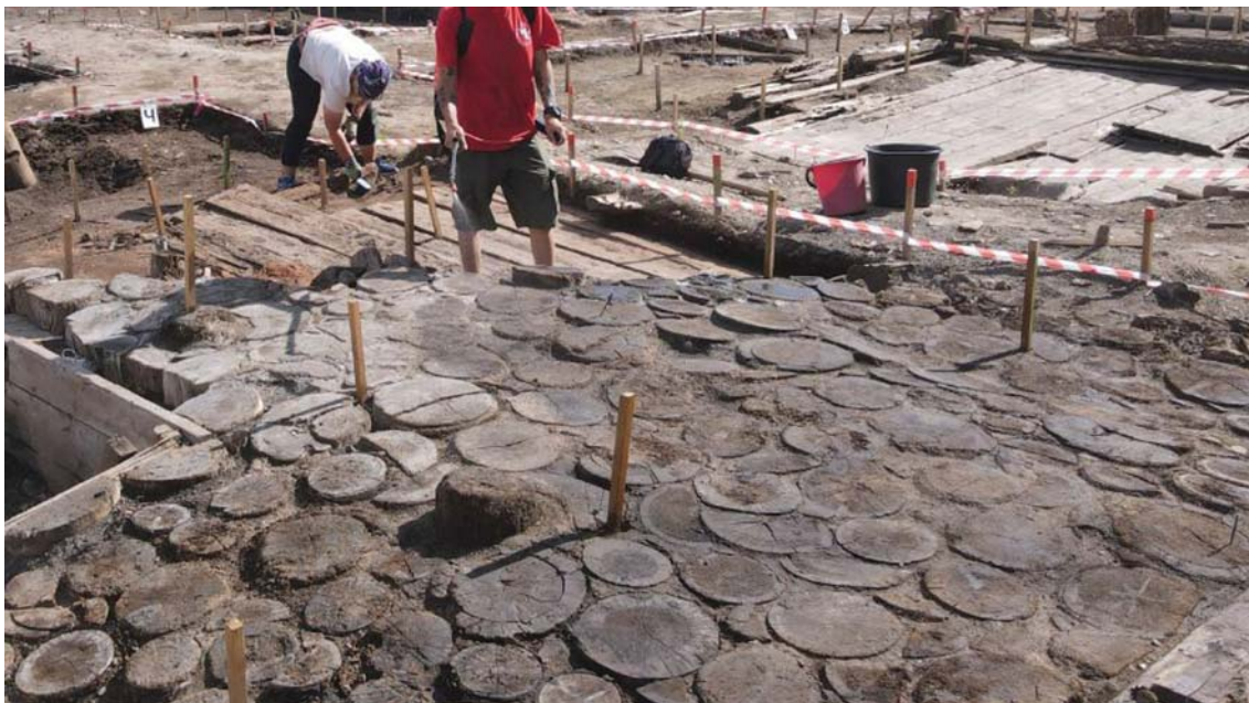
Рис. 2. Вид остатков чурочной (торцовой) мостовой или отмостки.