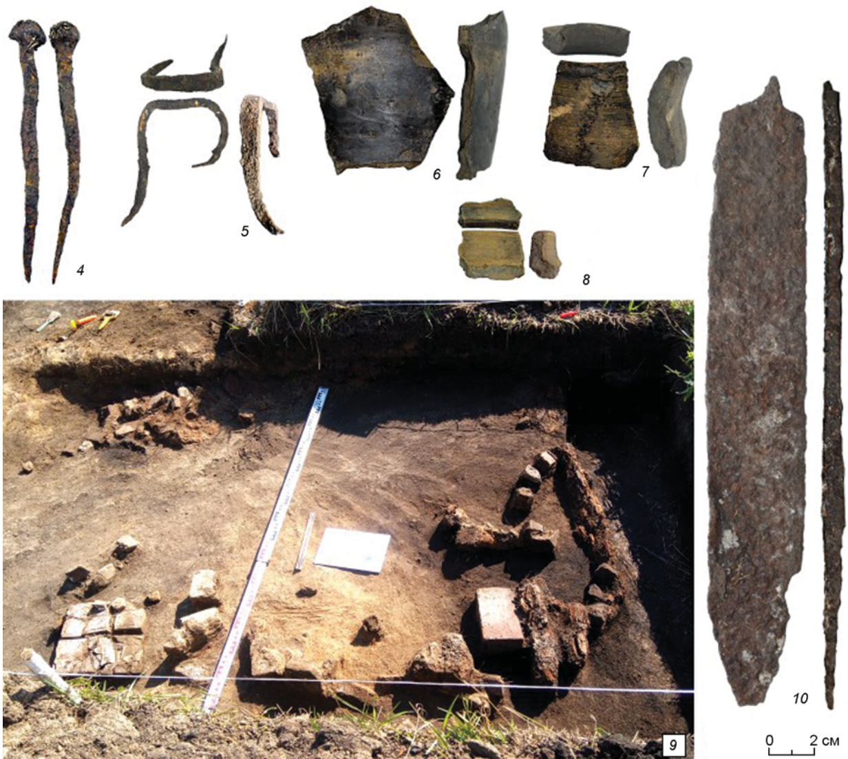
Схемы места расположения поселения Сеитово V (Буяновых юрт) и инвентарь из раскопа.

1 – схема окрестностей г. Тара с указанием расположения места поселения Сеитово V (бывших Буяновых юрт); 2 – схема Омской обл. с указанием г. Тара и поселения Сеитово V; 3 – схема расположения Буяновых юрт на местности и места раскопа в 2023 г.; 4–8, 10 – инвентарь: 4 – кованный гвоздь, 5 – кованная скоба; 6–8 – фрагменты керамических сосудов; 10 – нож (4–6 – железо; остальное – керамика); 9 – фотография остатков печи.