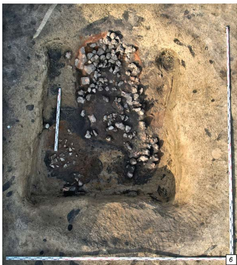
Рис. 1. Поселение Анисимово 1. Исследования 2023 г.

1 – общий вид памятника (фото с севера); 2–5 – находки Нового времени: 2 – сибирская монета «Копейка» 1779 г., 3 – пряжка, 4 – фрагмент глазурованного сосуда, 5 – кованый гвоздь; 6 – зачищенная средневековая постройка 1 с печной кладкой; 2, 3, 5 – металл; 4 – керамика.