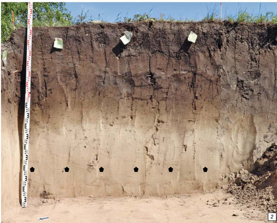
Рис. 2. Стоянка Сидориха, раскоп 2024 г.

1 – раскоп 2024 г., вид сверху; 2 – стратиграфический профиль, юго-восточная стенка.