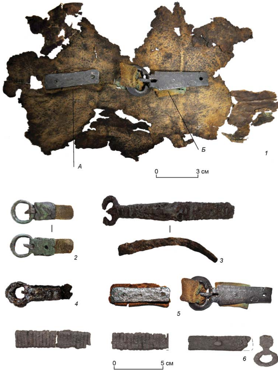
Рис. 3. Могильник Курайка. Находки.

полное представление есть только об одном экземпляре детского костюма, о котором мы писали выше. Схема кроя и отделки сходна с шелковыми кафтанами тюркского времени [Кубарев, 2005, с. 38–40]. В отношении других деталей костюма мы можем лишь строить предположения об их внешнем виде, опять же опираясь на известные образцы из пазырыкских и ноин-улинских захоронений [Садако Като, 1994; Полосьмак, 2001, рис. 85, 87–89; Руденко, 1962, таб. X, XI, XIV, XV]. Судя по всему, курайские мужчины носили длинные штаны из шерсти и/или кожи (рис. 3, 1). Стоит отметить отсутствие на женской и