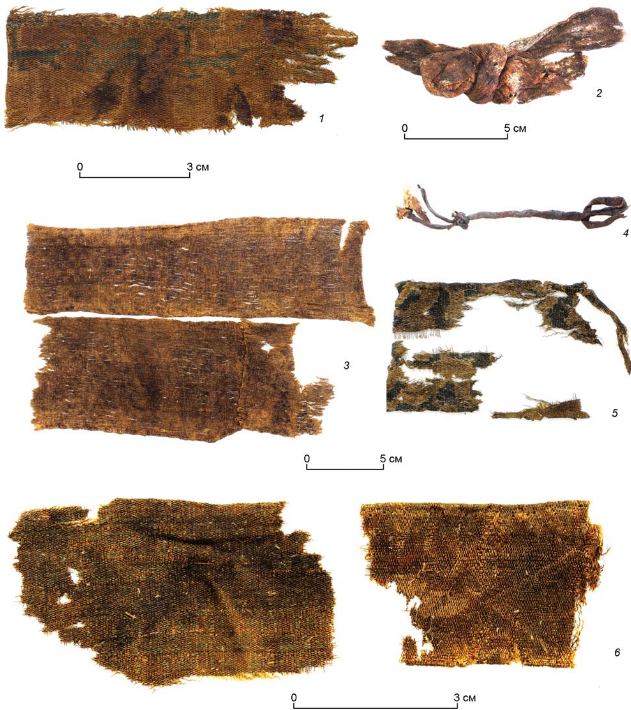
Рис. 1. Могильник Курайка. Фрагменты деталей одежды.

1, 5, 6 – ткани сложного переплетения с орнаментом; 2, 3 – ткани простого переплетения; 4 – остатки тонкого кожаного шнура.