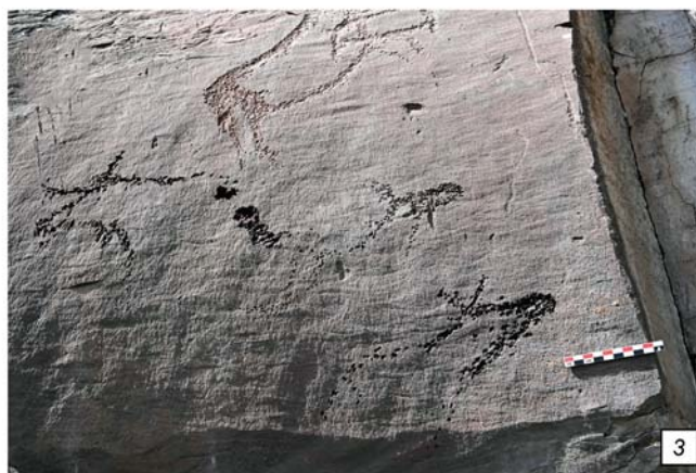
Рис. 3. Плоскость с парциальными изображениями, намечающими композицию (Шалаболинская писаница, 4 участок). 1 – общий вид на плоскость; 2 – нижняя часть плоскости с тремя парциальными изображениями; 3 – прорисовка парциальных изображений.