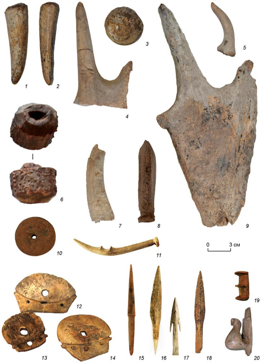
Рис. 2. Заготовки и отходы косторезного производства, орудия из кости и рога из зольника поселения Степное (1–10, 15) и могильника Степное-1 (16–20).

невых пород. Следы каменной индустрии в целом очень незначительны. Подавляющее большинство артефактов из кости являются заготовками, костями и рогом со следами спилов (рис. 2, 1–9). Среди глиняных предметов основная масса – недоделан-