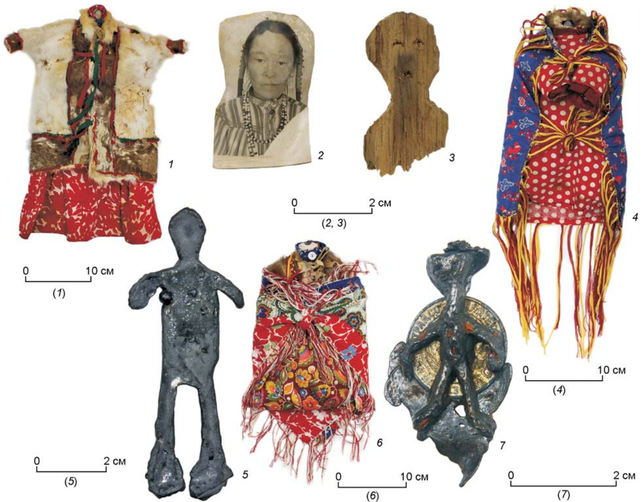
Рис. 2. Фигурки иттарма .

Следующая группа предметов – фигуры духов-покровителей – представлена тремя изделиями, одно из которых является бутылкой в форме сидящего на подставке медведя. Одета фигурка в шелковый распахнутый халат фиолетового цвета с втачными рукавами и треугольными ластовицами, выполненными из хлопчатобумажной ткани коричневого цвета с мелким рисунком. В плечевые швы вставлена полоска оранжевой ткани, воротник – стойка из темного сукна. Размеры фигурки 26 × 9,6 см. Дата изготовления изделия – начало XX в. (рис. 3, 1). Фигуры духов-покровителей шурышкарских хантов (д. Вытвозгор, Карвожи, Вершина Войкара) в виде винных бутылок ранее опубликованы А.В. Бауло [2016, с. 269].