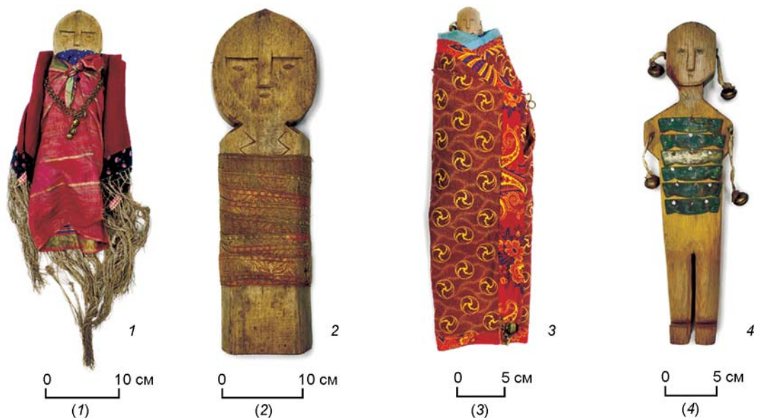
Рис. 3. Духи-покровители.

1, 2 – семейный дух-покровитель, березовские ханты; 3, 4 – дух-покровитель в военном облачении, ляпинские манси; 5, 6 – дух-покровитель в форме медведя, березовские ханты.