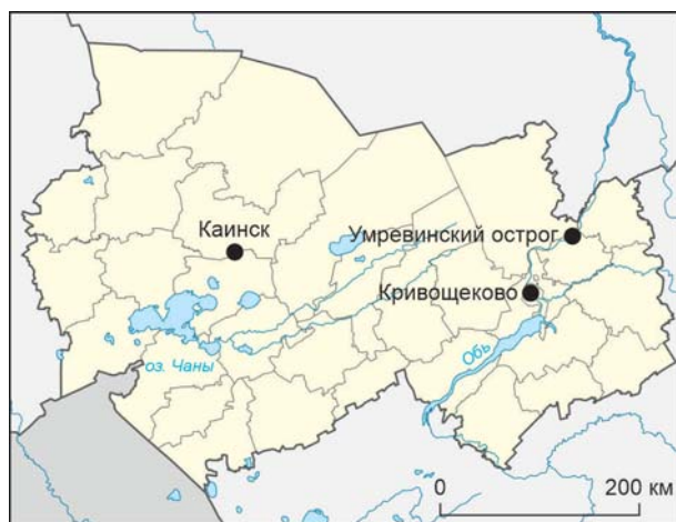
Рис. 1. Карта расположения исторических населенных пунктов на территории Новосибирской обл., в которых проводились широкомасштабные исследования православных некрополей.

Город Куйбышев в Новосибирской обл. основан в 1722 г. как Каинский пас (форпост). Первая церковь появилась в нем в 1751 г. Ее местоположение не установлено, но известно, что до 1787 г. она была перенесена на новое место. В этот год на месте старой деревянной церкви был заложен каменный Спасский собор, вокруг которого сформировался некрополь. Погребения около собора на исследованной площади совершались до середины XIX в. включительно, т.к. в коллекции натальных крестов отсутствуют экземпляры, изготовленные методом штамповки [Сальникова, Тимошенко, 2020]. Всего было изучено 414 захоронений, из которых 257 детских, 154 взрослых, возраст трех погребенных не установлен (см. таблицу).