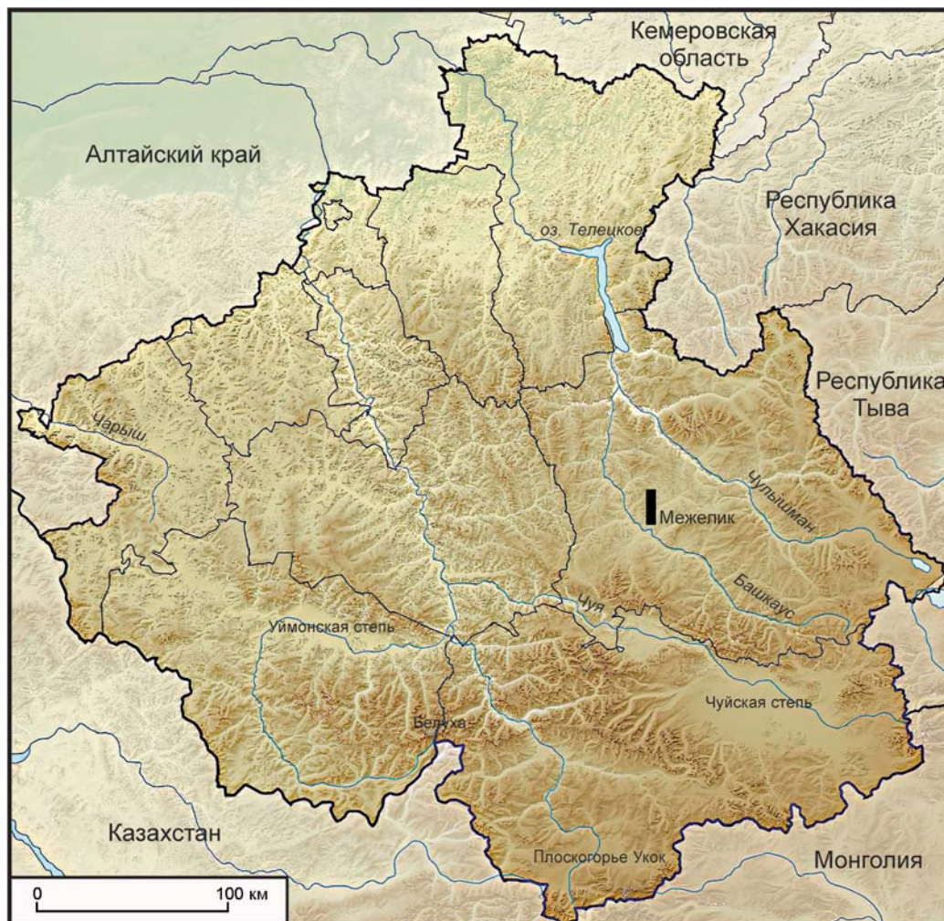
Рис. 1. Место расположения оленного камня в урочище Межелик.

и исследователи этого региона в своих трудах описывали и приводили изображения наиболее ярких образцов этих статуарных памятников. В особенности это относится к Чуйскому оленному камню. Первая сводка оленных камней Алтая, насчитывающая 45 экз., была предпринята В.Д. Кубаревым [1979а, табл. I–X]*. Так, по его мнению, только юстыдский комплекс оленных камней первоначально насчитывал более 30 статуарных памятников, большая часть которых была повалена и разбита в древности [Там же, с. 16]. Он же провел первые, ограниченные раскопки вокруг оленных камней и каменных выкладок юстыдского комплекса [Там же, с. 13–22, рис. 3–11]. В последующие годы в этом регионе были обнаружены и другие образцы этих монументальных памятников [Кубарев, Кочеев, 1988, с. 203–207, табл. I–III; Полосьмак, 1993, рис. 5–7; Кубарев В.Д., 1997; Молодин, Черемисин, Новиков, 2004; Кубарев Г.В., 2015, с. 290,