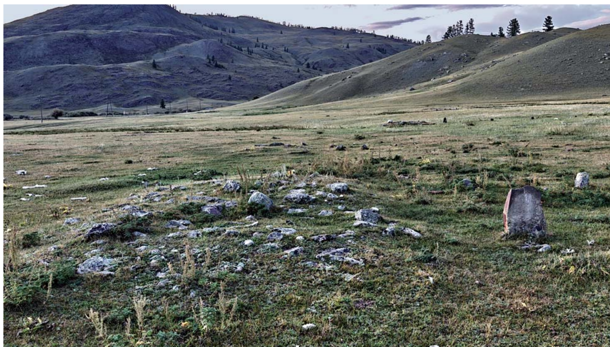
Рис. 2. Вид на тюркские смежные оградки и оленный камень, вкопанный у одной из них. Вид с юга.

Основное количество известных на сегодняшний день оленных камней Алтая приходится на южную его часть, граничащую с Монголией (Кош-Агачский р-он Республики Алтай). Именно в этом районе известно большое количество керексуров, с которыми оленные камни образовывали единый архитектурный комплекс. Здесь, в долине р. Юстыд известен крупнейший комплекс оленных камней, насчитывавший ок. 30 подобных статуарных памятников и более 100 кольцевидных ритуальных выкладок.