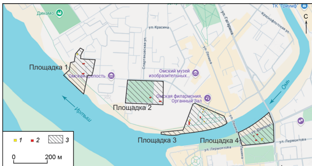
Рис. 1. План исторического центра г. Омска с обозначением мест проведения работ (на основе интернет-ресурса Google-maps).

В шурфе у здания казармы находки полностью отсутствовали, что, вероятно, связано с тем, что на этом месте был устроен фундамент выявленного в ходе работ кирпичного сооружения. Культурные слои XVII в. в ходе изысканий во второй Омской крепости обнаружить не удалось. Огромную сложность для продолжения работ на этой площадке представляет то, что практически вся исследуемая территория застроена, покрыта плиткой и асфальтом. Также здесь проходят многочисленные линии коммуникаций. Кроме этого, при реконструкции сохранившихся зданий второй Омской крепости в 2012–2016 гг. проводились масштабные строительные работы с использованием землеройной техники. Поэтому дальнейшие исследования на данной площадке возможны только при проведении предварительных строительных