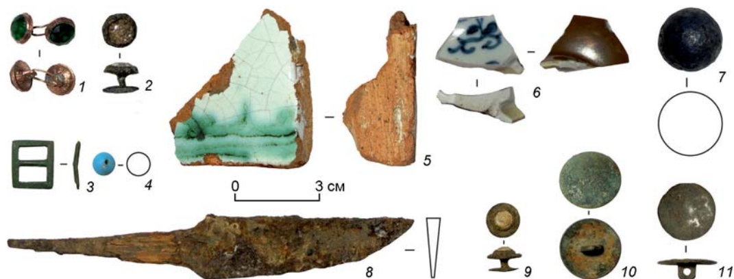
Рис. 3. Предметы, обнаруженные в ходе раскопок на территории первой и второй Омских крепостей.

1 – запонка (медь); 2, 9 – пуговица-запонка (медь); 3 – пряжка портупейная (бронза); 4 – бусина (стекло); 5 – печной изразец; 6 – фрагмент китайского фарфора; 7 – картежное ядро (железо); 8 – нож (железо); 10, 11 – мундирные пуговицы (медь).